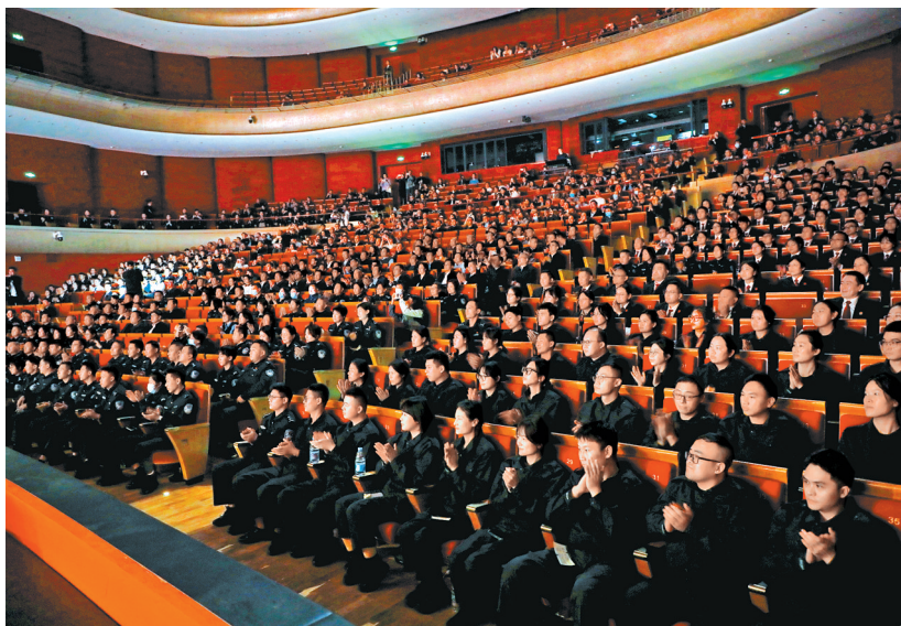
《正道沧桑之百年树人》现场观众。

市纪委监委将深挖本土廉洁元素，用好用活此类警示教育资源，持续创新廉洁文化载体和表现形式，在教育引导、氛围营造、融入结合上下更大功夫，推