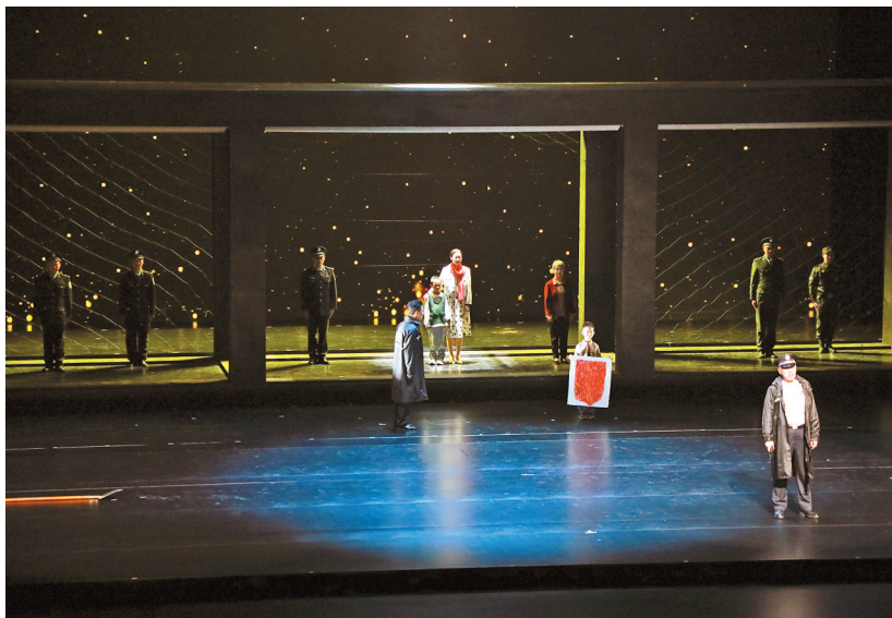
《正道沧桑之百年树人》演出剧照。